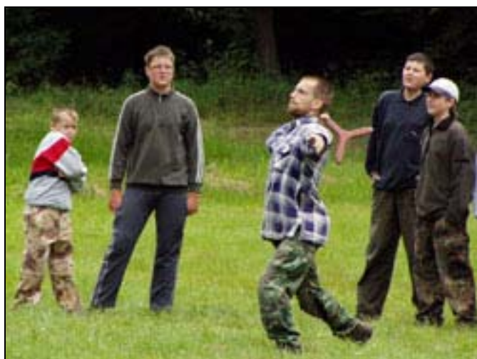
Učíme se házet bumerangem...