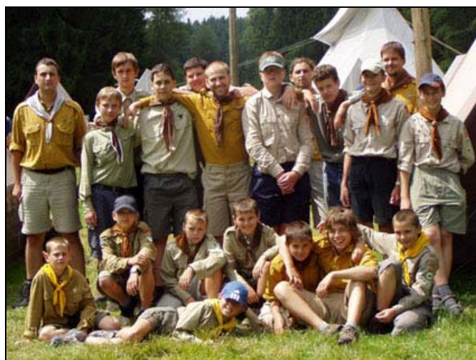
A společné foto na závěr.

Další fotografie naleznete v brzké době na http://poutnici.sf.cz .