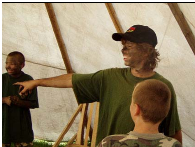
Maskování – příprava na tajnou operaci.