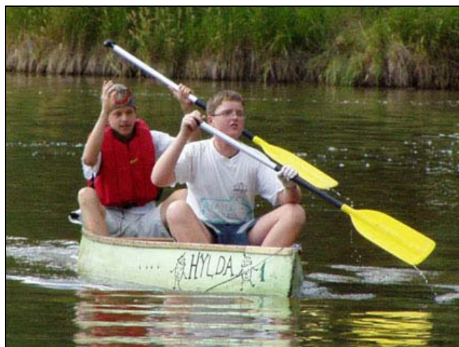
Synchronizovaná jízda na lodi v podání dvojice Sadám a Koala