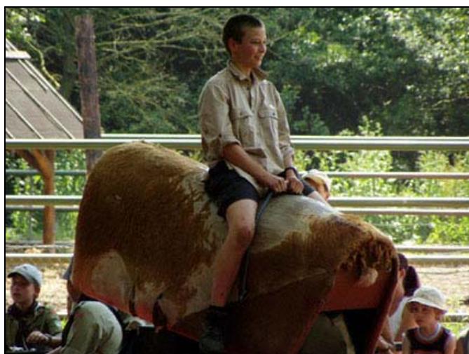
Netopýr předvádí, jak se jezdí na býkovi.