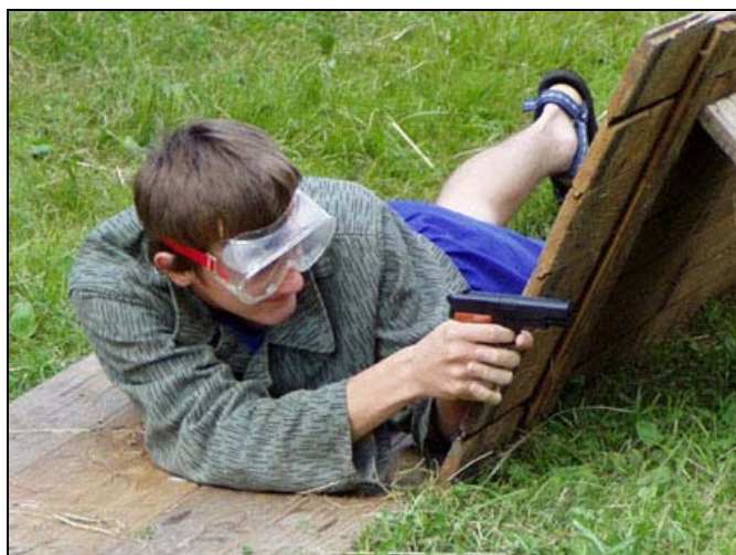
...a taky střelbu z kuličkovky vleže na cíl.