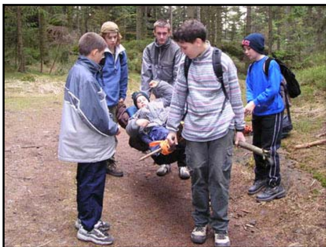
Transport raněného – ještě, že to byl jen nácvik