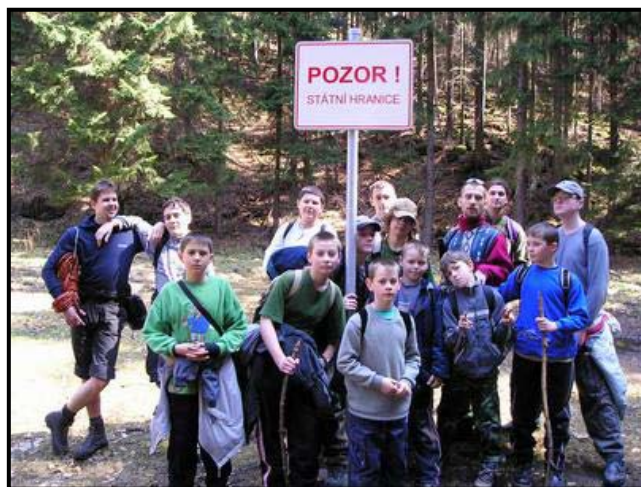
Agenti zvažují, jestli prchnou do Polska